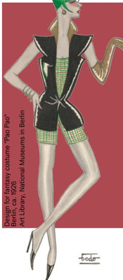
Design for fantasy costume "Pao Pao" Berlin, ca. 1926 Art Library, National Museums in Berlin

Design: Dodo Born: 10 February 1907 in Berlin Died: 22 December 1998 in London Fashion designer, illustrator, painter